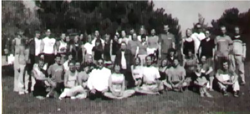
“The Kie Buddhist Center” đang huấn luyện 46 nam nữ cư sĩ thành giảng sư, Ukraine (một quốc gia gần Nga)

Vì giới hạn của bài viết nên tôi chỉ liệt kê sơ lược 15 sinh hoạt của một số ít chư Tăng Ni và cư sĩ như là vài gợi ý về cách đem đạo vào đời qua nhiều sinh hoạt khác nhau mà quý vị đó thực hiện.