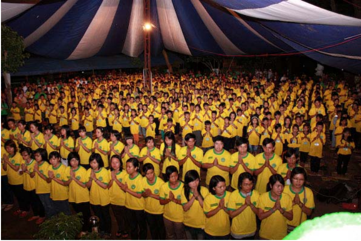
TT. Viên Giác, chùa Từ Tân và CLB TNPT TP.HCM, chương trình giao lưu thanh thiếu niên trong dịp hè – 2011