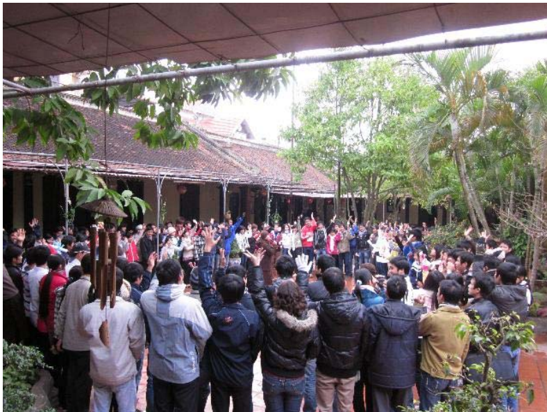
Sinh viên của 6 trường đại học và ĐH Công nghiệp HN đến học Thiền, chùa Đình Quán, HN.9.1.11