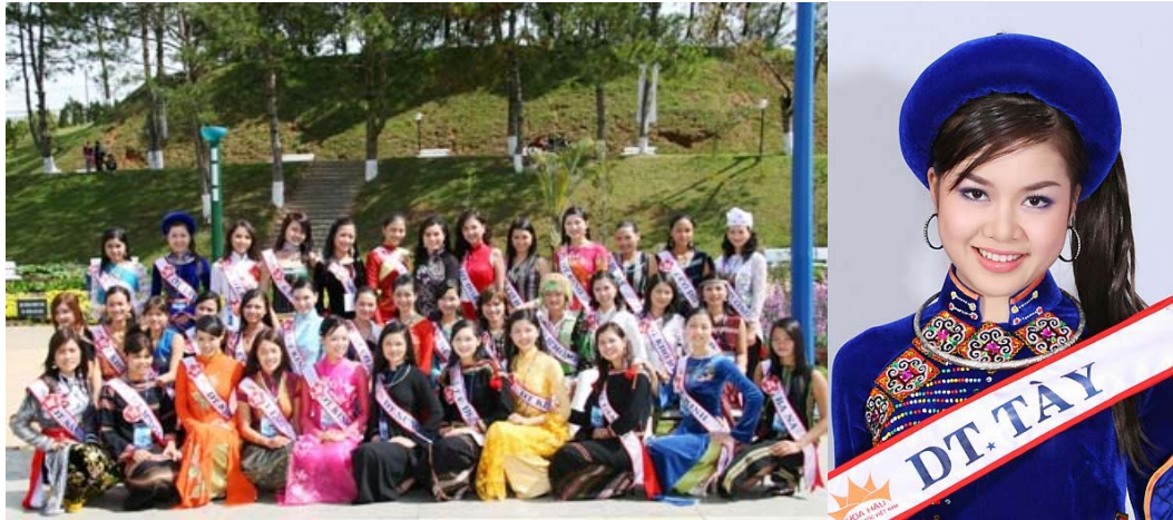
Hoa hậu Dân tộc, chuẩn bị thi Thiền-Yoga tại Thiền viện Trúc Lâm Đà Lạt, 6 giờ sáng, 11.2.2007