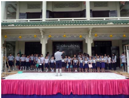
Các “ca sĩ” sắp lên sân khấu

Thiền-Tịnh-Mật giúp con người đẹp hơn, thông minh hơn, mạnh khỏe hơn, sống lâu hơn, chống bệnh tật và lão hóa. Vì vậy, không những chỉ riêng tuổi trẻ là thành phần rất hâm mộ Thiền mà người lớn trong tất cả các môi trường văn hóa khác cũng thế.