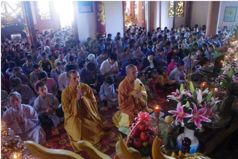
Nguyện cầu kẻ âm siêu thoát, người dương an lành