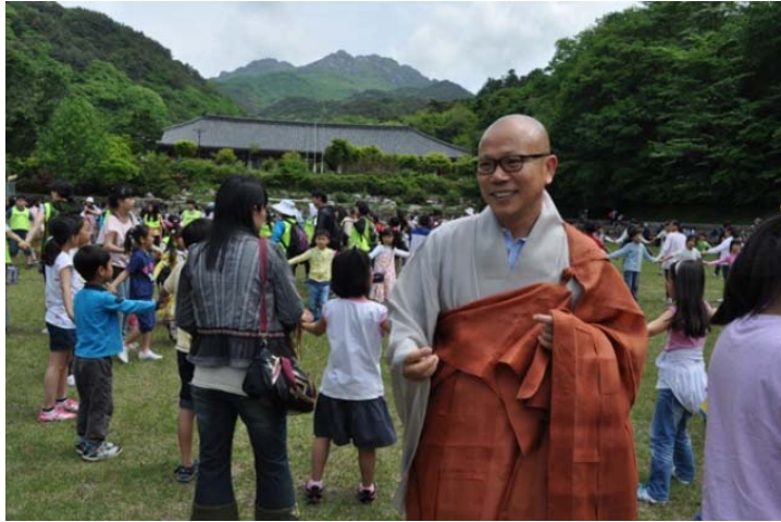
Phật tử trẻ sinh hoạt ngoài trời (Web:đpnn)