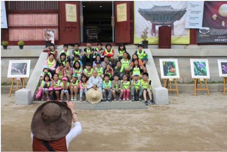
Ni cô với các “họa sĩ” tí hon