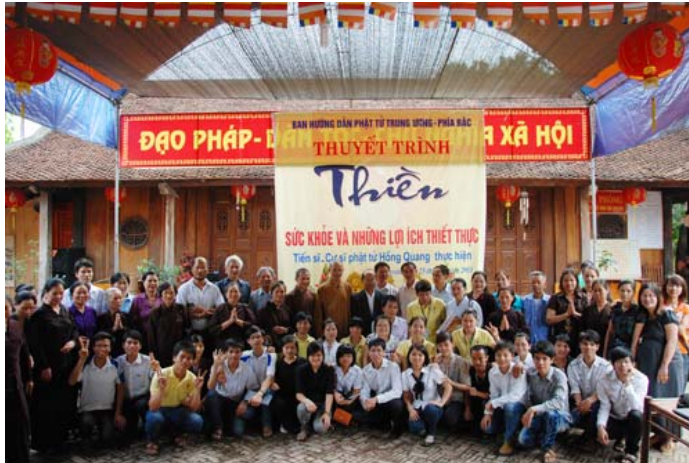
Chùa Phủ Liễn Thái Nguyên, tháng 5.2011