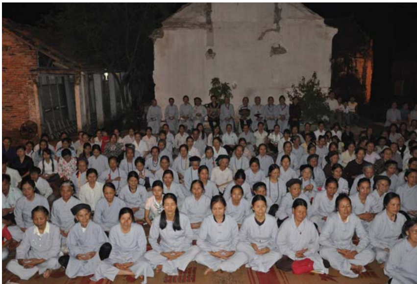
Chùa Hoa Dương Vĩnh Phúc, 5/2011