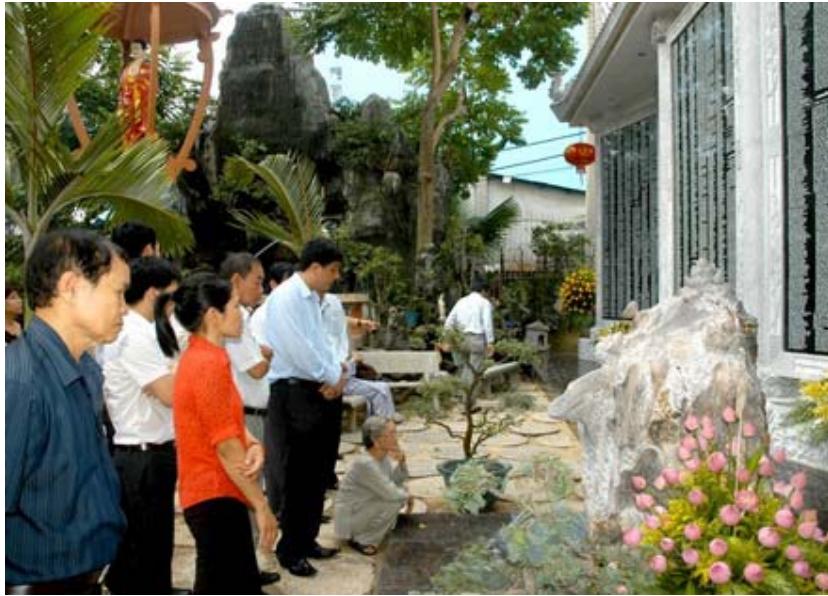
Đông đảo Phật tử đến viếng chùa chiêm bái bộ thạch kinh trong Mùa đại lễ Vu lan báo hiếu

Để thực hiện bộ kinh trên đá trong khuôn viên chùa Pháp Hoa, nhóm Phật tử thực hiện đã đặt mua 70 m 2 đá grannite đen khổ lớn từ Ấn Độ và gần 40 tấn đá trắng vân mây từ tỉnh Thanh Hóa. Công việc được triển khai liên tục ngày đêm với số lượng các nghệ nhân, thợ điêu khắc vào lúc cao điểm tới gần 30 người, gồm nhiều nhóm thợ đến từ Ninh Bình, Vĩnh Phúc, Hà Tây và Đà Nẵng, những vùng đất nổi tiếng của cả nước về nghệ thuật khắc, chạm trên đá.