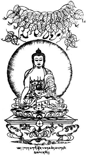
Phật Thích Ca Mâu Ni Lama Zopa Rinpoche phát họa

Tựa đề tiếng Anh: The Noble Mahayana Sanghatasutra Dharma-Paryaya