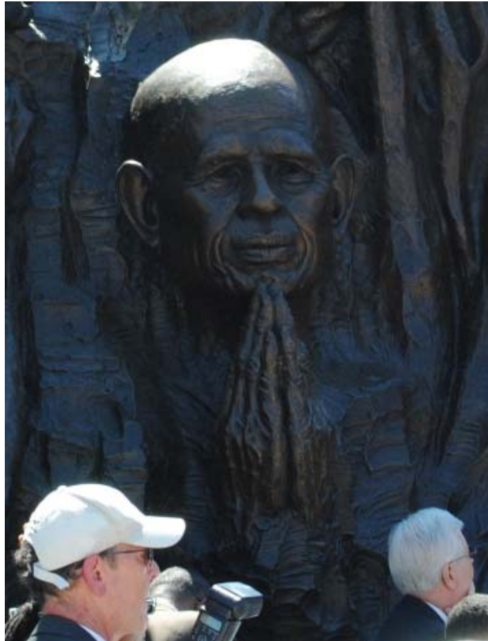
Thiền sư Nhất Hạnh được vinh danh là người vận động cho những giải pháp hoà bình trong chiến tranh Việt Nam và sau biến cố 11/9/2001 đã thỉnh cầu Hoa Kỳ dùng ngoại giao thay vũ khí ở Afghanistan và Iraq.