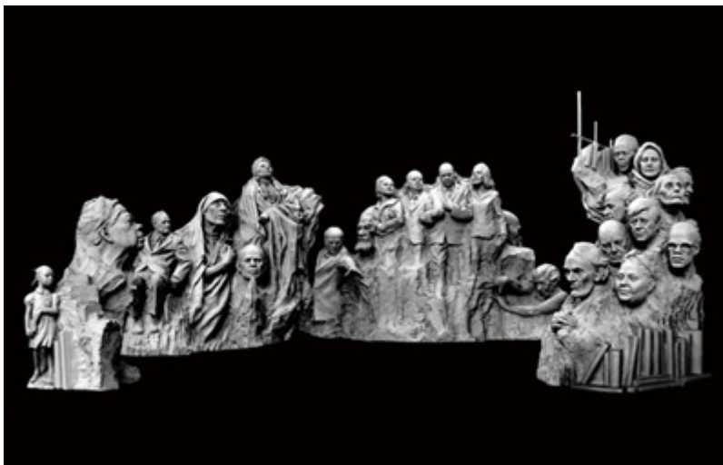
Tượng Đài Nhân Đạo vừa được khánh thành tại Oakland.

Tượng đài, với chi phí $8 triệu, được dựng phía Tây của Henry J. Kaiser Memorial Park, ngay trung tâm thành phố Oakland.