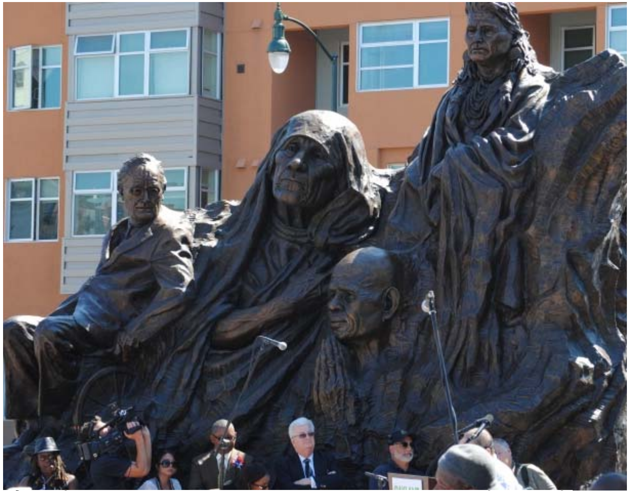
Tổng thống Franklin Delano Roosevelt (bên trái), Mẹ Teresa, Thiền sư Nhất Hạnh và Tộc trưởng da đỏ Joseph