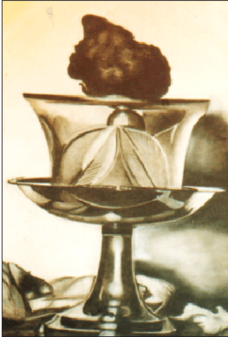
ඒ දමනය කළ සිත ගිණිගෙන දවා අළු කළ නොහැකිවිය