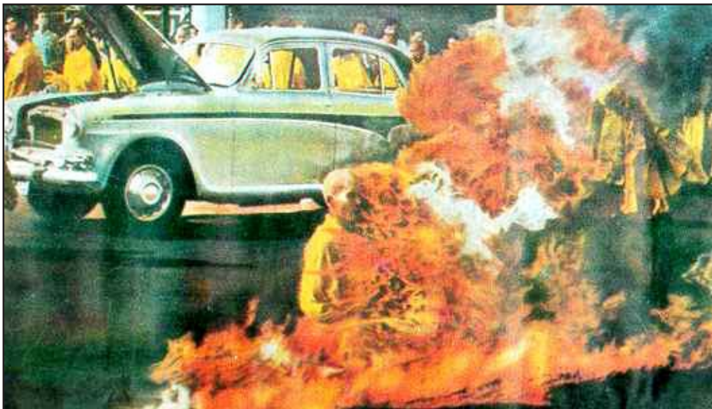
මිනිස් සංවේදනා උඩු යටිකුරු කළ එම සිදුවීම චිත්‍ර ශිල්පියෙකුගේ ඇසින්.