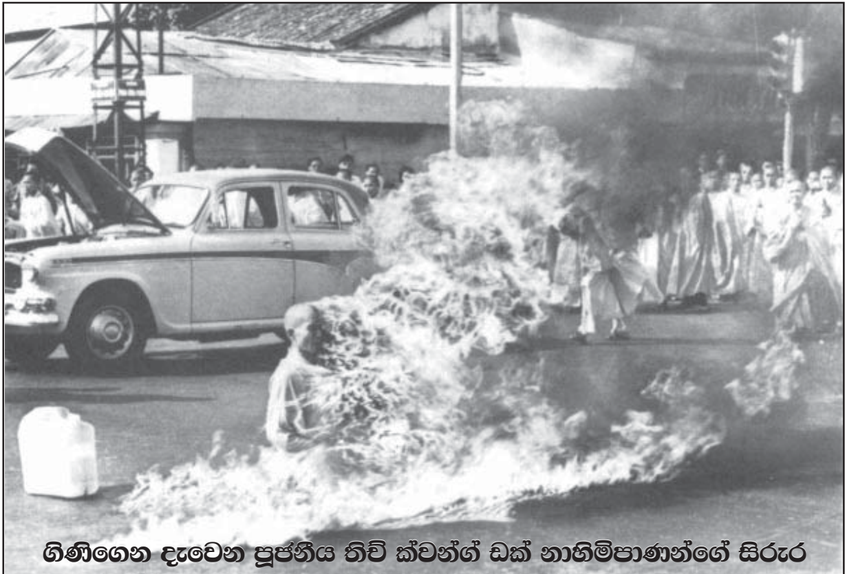
ගිණිගෙන දැවෙන පූජනීය තිව් ක්වන්ග් ඩක් නාහිමිපාණන්ගේ සිරුර

වියට්නාම් යුද්ධයේදී ඇමරිකානු ත්‍රස්තවාදයට සහ ඇමරිකානු භීෂණයට එරෙහිව ලෝක ජන මතයක් ගොඩනැගීම උදෙසා, වියට්නාම් ජාතික බෞද්ධ නිකුන් වහන්සේ නමක් වූ "තිව් ක්වන්ග් ඩක්" නාහිමිපාණෝ, (Most Venerable Thich Quang Duc Nayaka Thera) 1963 ජූනි 11 දා වියට්නාමයේ සයිගෝන් නුවර ප්‍රධාන වීදියකදී (වර්තමානයේ Nguyen Dinh Chieu & Cach Mang Thang Tam Street) මේ ආකාරයට තම සිරුරට ගිනි තබාගෙන අභය චිත්තවෙන් අපවත් වූහ.