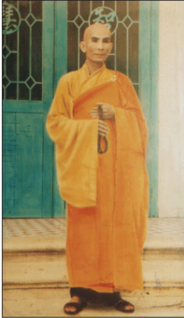
අතිපූජනීය තිච්චි ක්වන්ග් ඩක් නාහිමිපාණන් වහන්සේ පෙනීසිටි චිකම ඡායාරූපය මෙයයි.