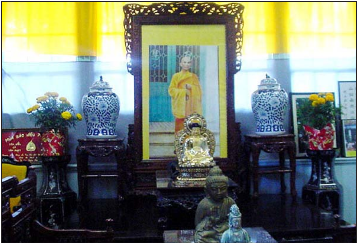
දමනය කළ සිතැති, ඒ ශ්‍රේෂ්ඨ හිමිපාණන් වහන්සේගේ මතකය අද මෙසේ දිස්වේ.